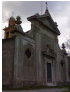
La facciata della chiesa di Nostra Signora Del Buon Consiglio a Brasile.

Il club 'La Saletta Del Gusto' nasce a Genova nell'ottobre 2007; il punto di riferimento è a Bolzaneto, ai piedi della chiesa di Nostra Signora Del Buon Consiglio in località Brasile, sulla storica di Bolzaneto.